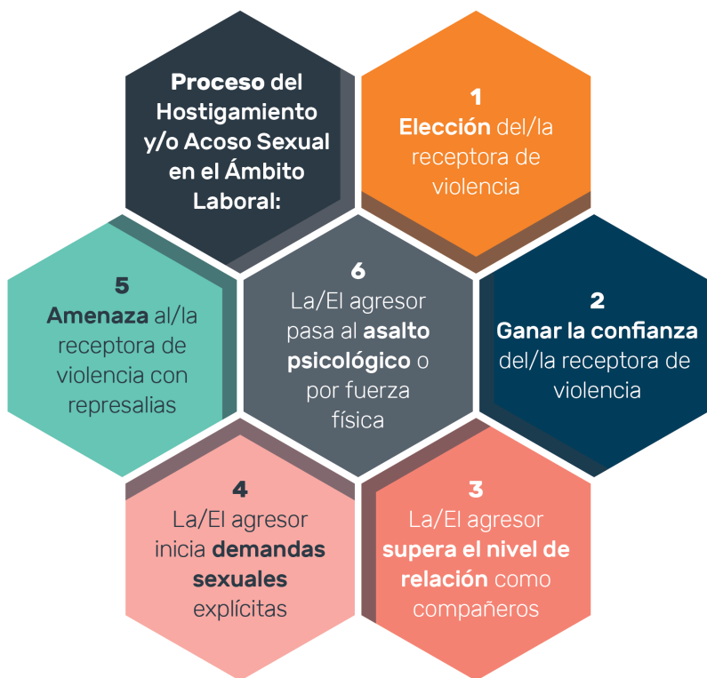
Figura basada en el Proceso del Hostigamiento y/o Acoso Sexual en el Ámbito Laboral. Pag.30.